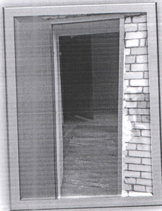
Запасной выход №2