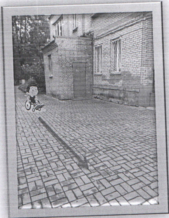
Запасной выход №1